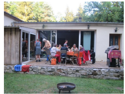
Gruppenraum mit Sauna und Feuerstelle